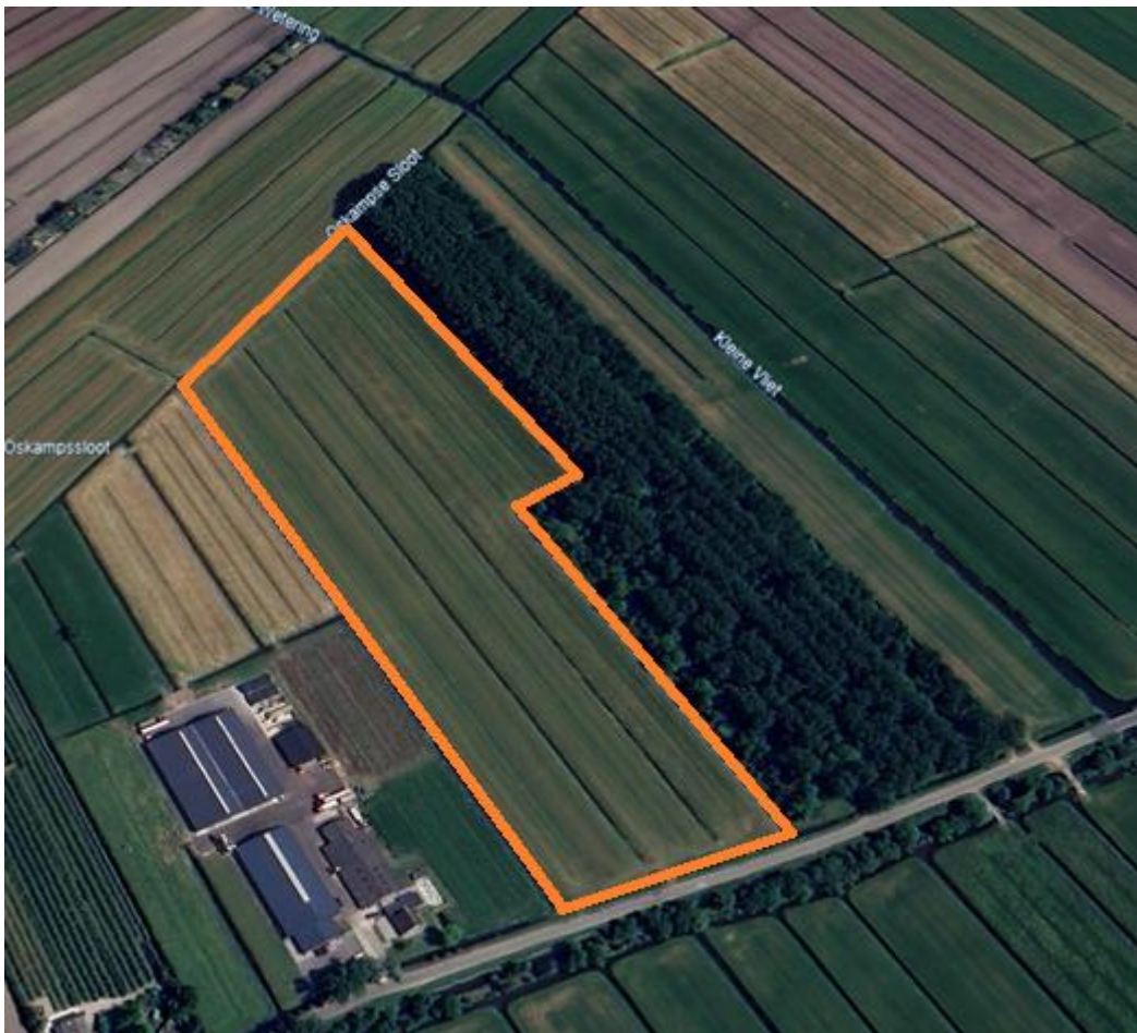
Schets Google Earth