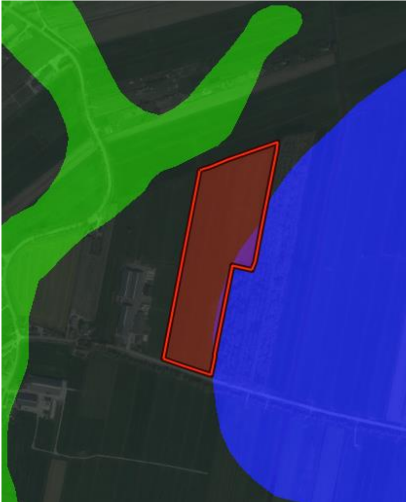
Schets GeoWeb grondsoort